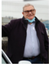
L'entreprise s'adapte à des relations plus écologiques