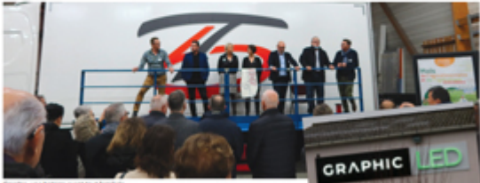
Graphic, une histoire avant tout familiale

Le 17 février, la PME, qui emploie aujourd'hui 65 personnes, a fêté ses 50 ans, en présence notamment des membres du Club des entreprises du Pays Mellois Haut Val de Sèvre, dont elle fait partie.