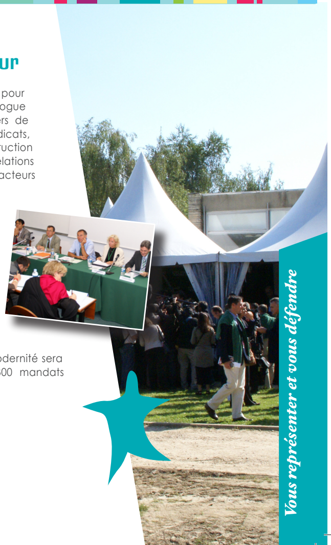
Vous représenter et vous défendre