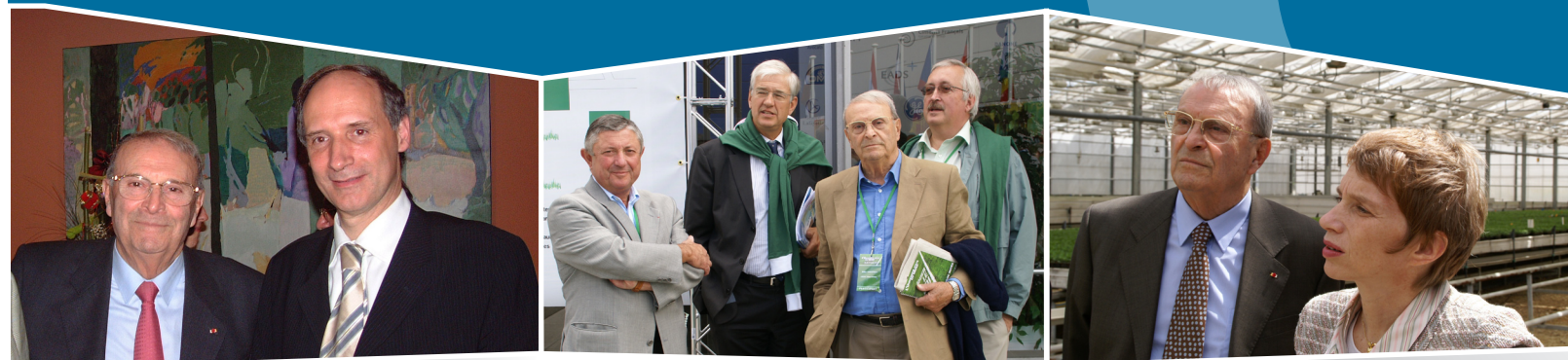
★ Avec Hugues-Arnaud Mayer, vice-président du MEDEF National à la rencontre des entreprises